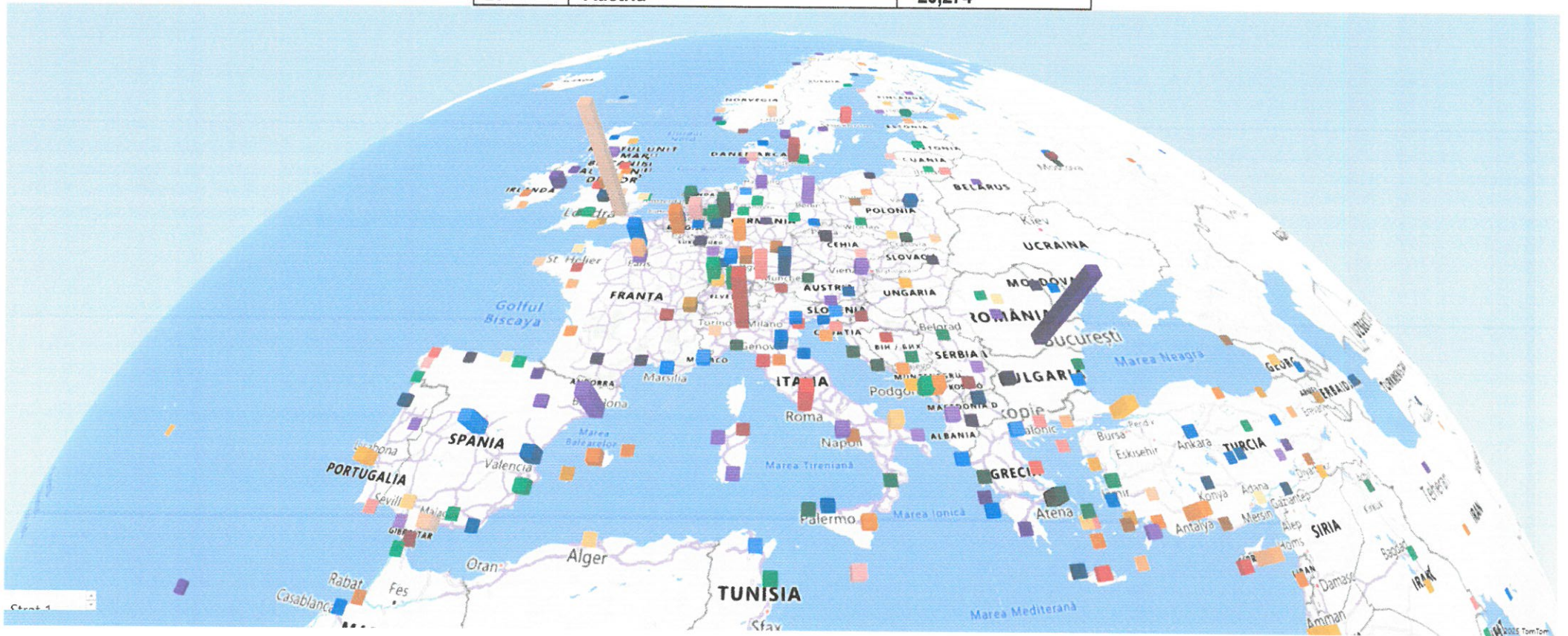
Harta 3D a Europei și Asia Mică TOP Aeroporturi de destinație preferate de populația rezidentă la o rază de 150 km față de Arad, Informa ASM Catchment Analyser pentru anul 2024